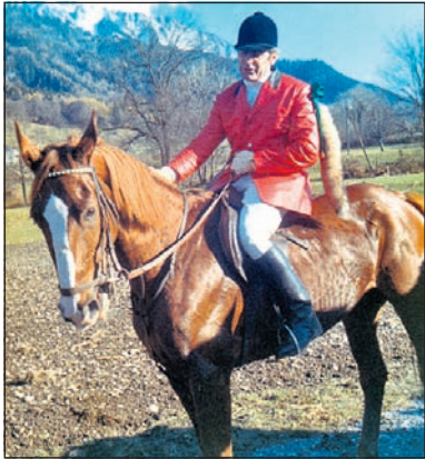
Als «Master» an der Fuchsjagd der Husaren.