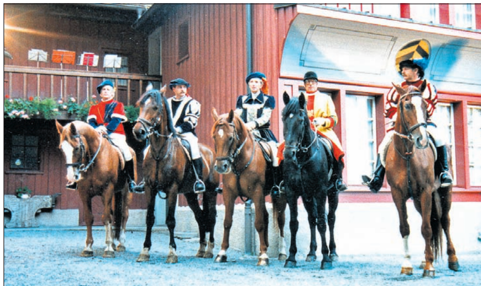
Mit Husaren-Mitgliedern bereit zum Festtagsritt.