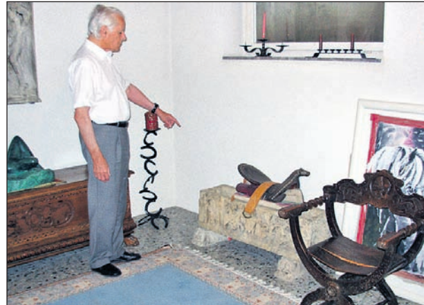
Seltene Reitutensilien in seiner «Schatzkammer».